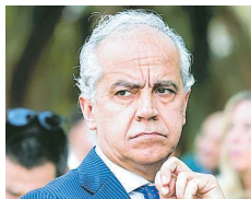
Il ministro dell'Interno Piantedosi

Piantedosi: «Dialogo sui Cpr ma la decisione è del Governo»