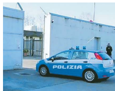
L'ingresso del Cpr di Gradisca

Fedriga difende i centri rimpatrio Le opposizioni: non funzionano